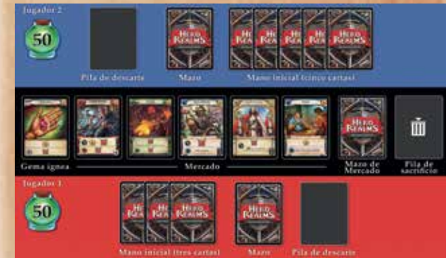
Disposición de inicio de partida. El jugador 1 juega primero.

Se echa a suertes el jugador que iniciará la partida. Ese jugador roba tres cartas (los jugadores siempre roban de su propio mazo personal). El segundo jugador roba cinco cartas.